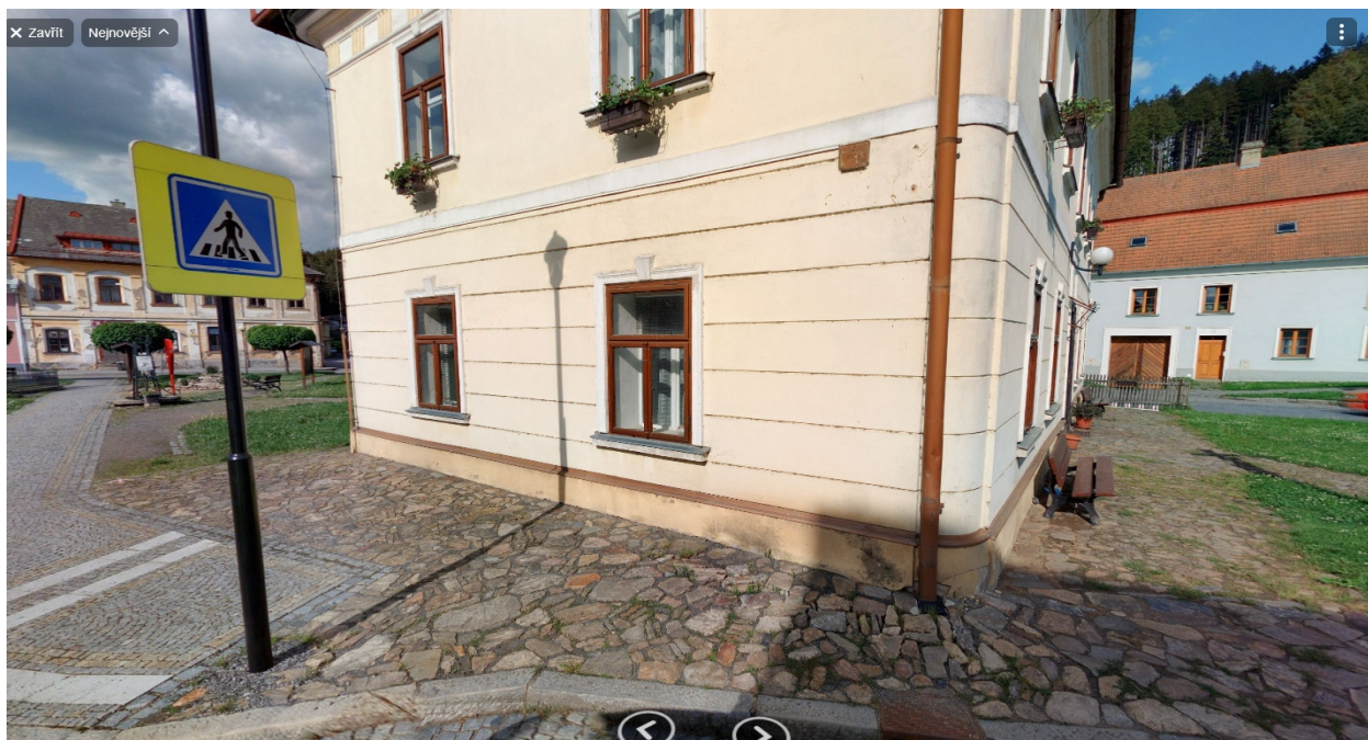
Obr. č. 2 Příklad rozvolněné dlažby s širokými spárami – okolí budovy čp. 162 v Jimramově