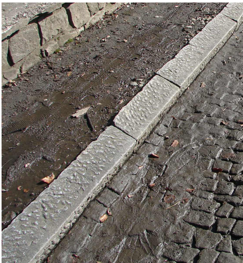
Obr. č. 1 Příklad hruběji opracovaného obrubníku z Jimramova